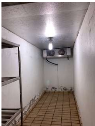
Câmara fria desligada, sem uso