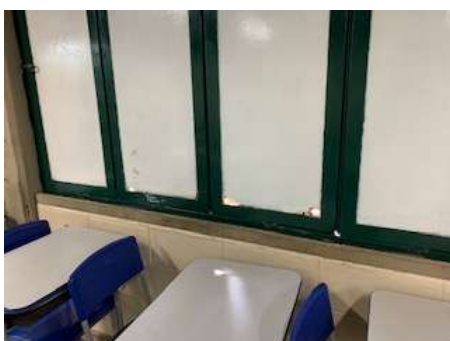
Manutenção/Troca das janelas