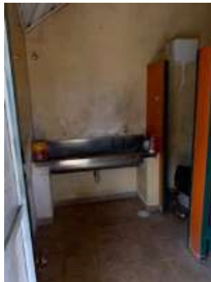
Banheiros de Ginásio Poliesportivo