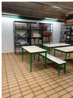
Adequação/Reforma da despensa