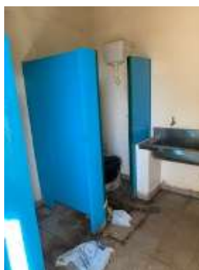
Banheiro do Ginásio Poliesportivo