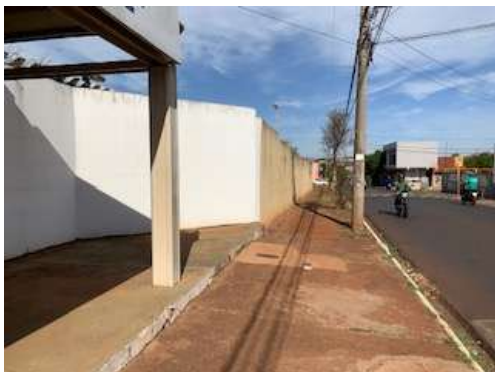
Local para a nova entrada para os alunos