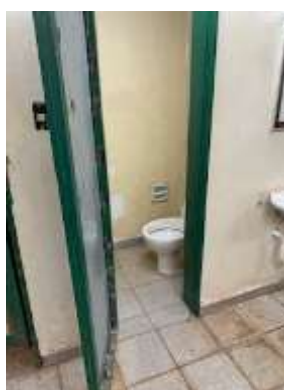
Vestiário do Ginásio Poliesportivo