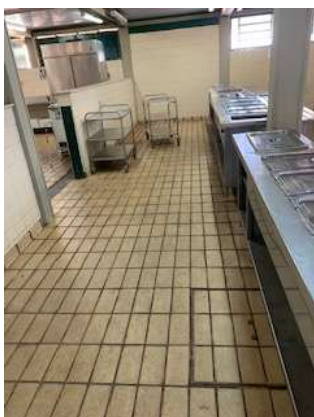
Adequação/Reforma da cozinha