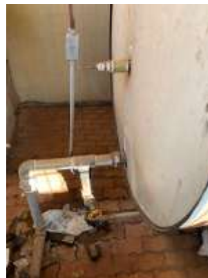
Problemas na caldeira