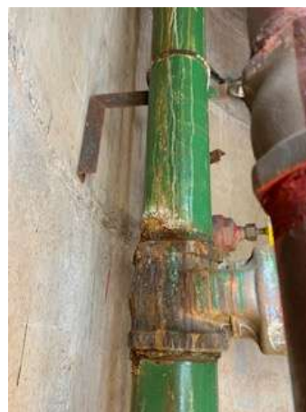
Tubulação da caixa d' água