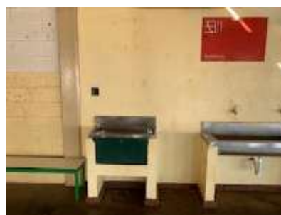
Bebedores do refeitório