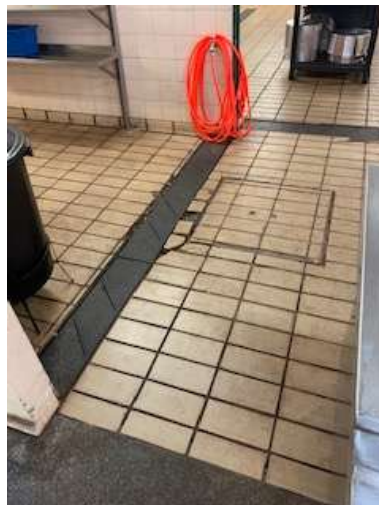
Piso da cozinha