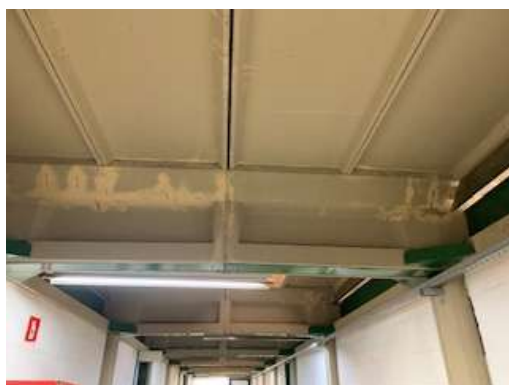
Solução para as lajes