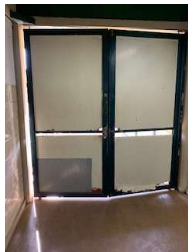
Manutenção/Troca de portas