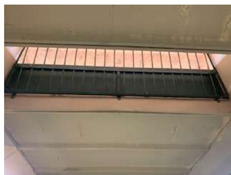
Solução dos vão da laje